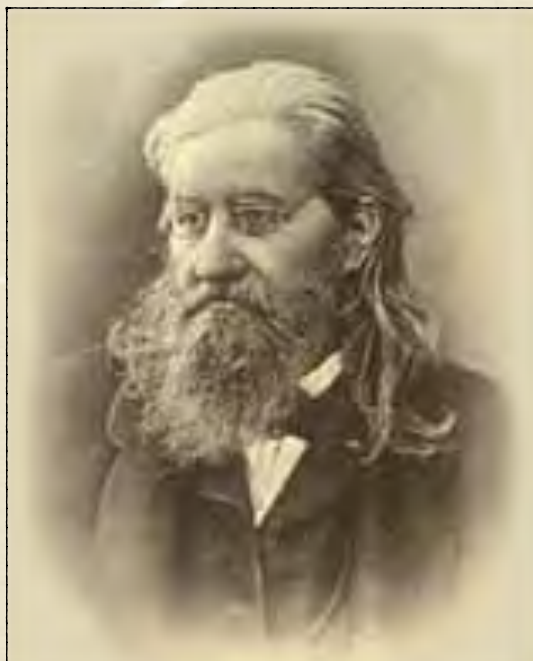
Constantin Hering (1800-1880)